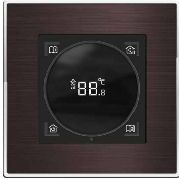
G1新风旋钮温控器 (单新风)